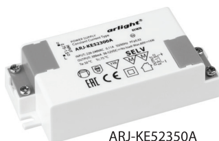
ARJ-KE52350A ARJ-KE30600 ARJ-KE36500 ARJ-KE42500A ARJ-KE52300A ARJ-KE30700

В пластиковом корпусе С корректором коэффициента мощности