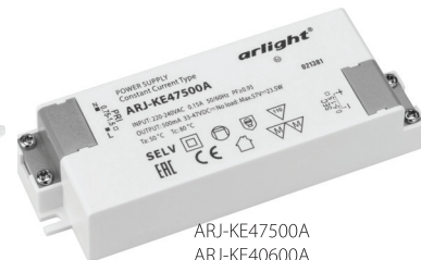
ARJ-KE47500A ARJ-KE40600A ARJ-KE50600 ARJ-KE43700A ARJ-KE51700A ARJ-KE341050A ARJ-KE401050A